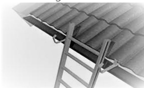
Eksempel på en type sklisikring